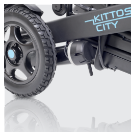
Nuevo sistema de fácil acceso para la conexión/desconexión del motor