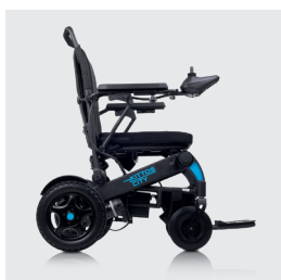
Peso total sin baterías 29,30 kg