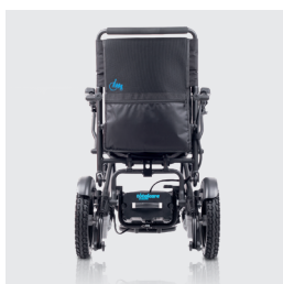
Ancho total 59 cm Permite pasar sin problemas por puertas