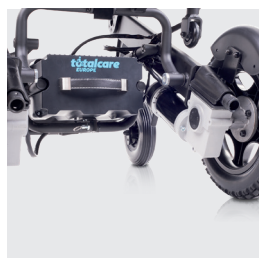
Nuevo sistema de mejora de extracción de la batería (Batería de 10, 20 o 30Ah)