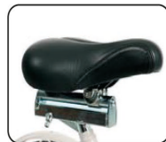
P4 - Sillín ajustable (140 mm)