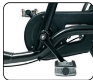
O1 - Piñón libre