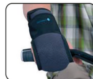
E11 - Fijación de mano