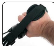
E9 - Cinchas de mano