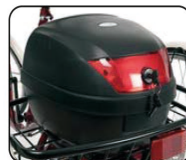
E5 - Baúl (30 litros)