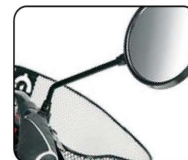
E8 - Espejo retrovisor