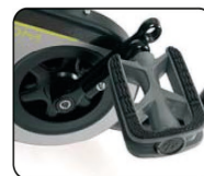
F5 - Pedales ajustables en longitud (22 mm)