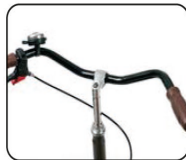
S3 - Manillar versión ciudad