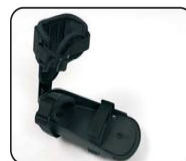
F4 - Pedales con fijación de tobillo