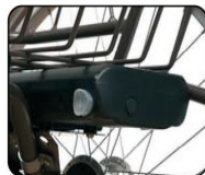
BAT 9 - BAT 13 - Batería de repuesto 9A - 13 A