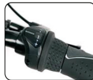
O3 - Sistema con 3 o 7 marchas