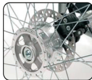
B1 - Freno de disco ruedas traseras