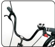
S1 - Manillar estándar