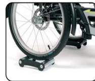
E13 - Función triciclo estático