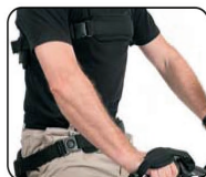
P3 - Soporte de respaldo y pélvico