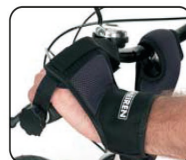
E10 - Fijación de mano con cinchas