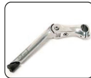
S5 - Soporte de dirección ajustable (-10° / +50°)