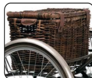
E4 - Cesta vintage