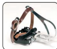
F2 - Pedales tipo ciclista