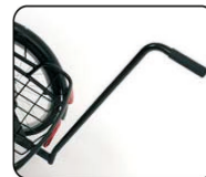
E1 - Barra de empuje (335 mm o 605 mm)