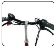
S2 - Manillar recto