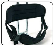
P1 - Soporte pélvico