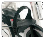
F1 - Pedales con fijación