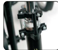
D1 - Sistema de bloqueo para manillar