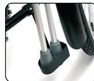
E6 - Soporte para muletas