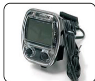
E3 - Velocímetro (baterías incluidas)