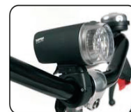
E2 - luz delantera y trasera (baterías incluidas)