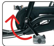
O2 - Freno con los pedales