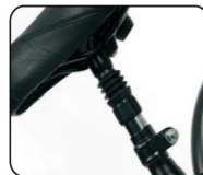
P5 - Tubo de sillín con amortiguador