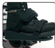
F3 - Pedales con sandalias