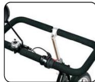
S4 - Manillar cerrado