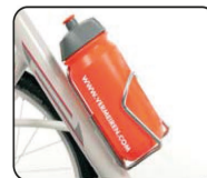
E7 - Soporte de bebida