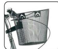
E14 - Cesta delantera