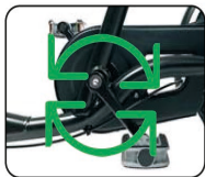
O6 - Piñón fijo