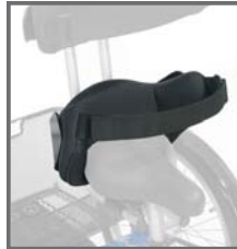
CONTROL DE TRONCO AJUSTABLE CON CINTURÓN