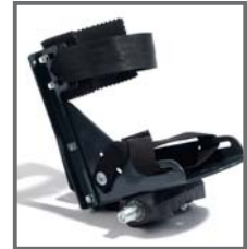
PEDALES CON FIJACIÓN DE TOBILLO