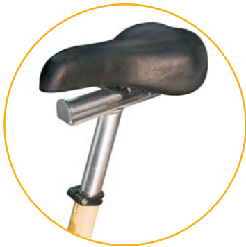
REGULACIÓN DE ASIENTO