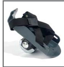
PEDALES CON SANDALIA