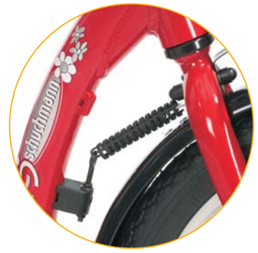
MUELLE RETORNO DE DIRECCIÓN