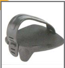
PEDALES CON FIJACIÓN