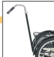
BARRA DE EMPUJE