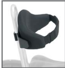
RESPALDO AJUSTABLE CON CINTURÓN