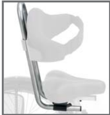
BARRA DE RESPALDO