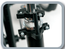
D1 - Sistema de bloqueo para manillar