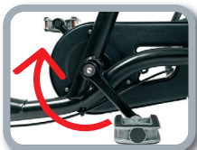
O2 - Freno con los pedales