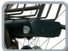
BAT 9 - BAT 13 - Batería de repuesto 9A - 13 A