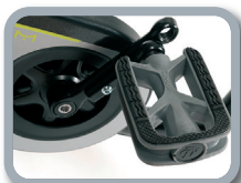
F5 - Pedales ajustables en longitud (22 mm)