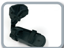
F4 - Pedales con fijación de tobillo