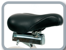
P4 - Sillín ajustable (140 mm)