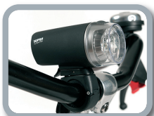
E2 - Luz delantera y trasera (baterías incluidas)