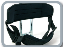
P2 - Soporte de respaldo