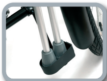
E6 - Soporte para muletas