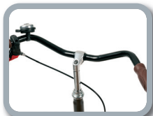
S3 - Manillar versión ciudad