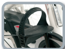
F1 - Pedales con fijación