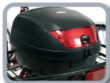
E5 - Baúl (30 litros)