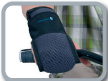
E11 - Fijación de mano