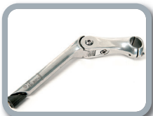
S5 - Soporte de dirección ajustable (-10° / +50°)