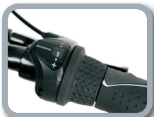
O3 - Sistema con 3 o 7 marchas