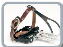
F2 - Pedales tipo ciclista