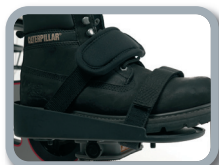
F3 - Pedales con sandalias