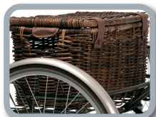
E4 - Cesta vintage