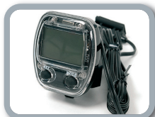
E3 - Cuentakilómetros (baterías incluidas)