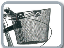
E14 - Cesta delantera