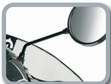
E8 - Espejo retrovisor