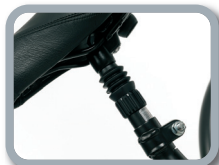
P5 - Tubo de sillín con amortiguador