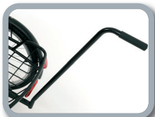
E1 - Barra de empuje (335 mm o 605 mm)