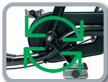
O6 - Piñón fijo