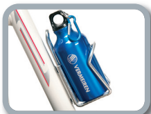
E7 - Soporte de bebida