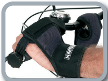
E10 - Fijación de mano con cinchas