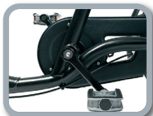
O1 + B1 - Piñón libre