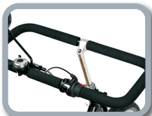
S4 - Manillar cerrado