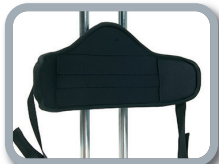
P1 - Soporte pélvico