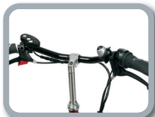
S2 - Manillar recto