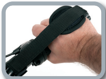
E9 - Cinchas de mano