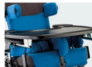
Bandeja plástico (negra)