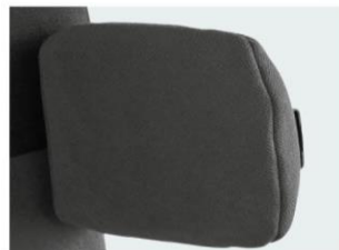
Soportes laterales fijos PU