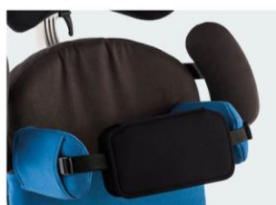
Soporte anterior torácico Talla 3