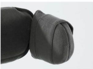
Soportes laterales rep. plano