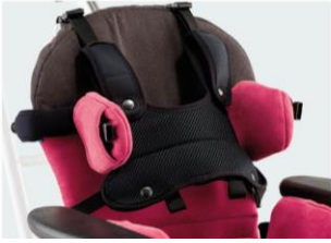
Peto torácico negro