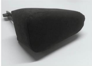
Cuña Abductora Taco