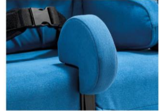
Cuña abductora disco