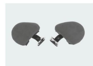
Soportes laterales básicos