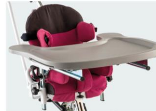
Bandeja plástico (gris)