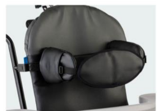
Soporte anterior torácico Tallas 1 y 2