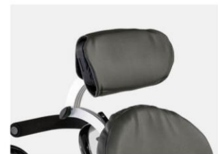
Reposacabezas plano Talla 1 y 2 gris ébano