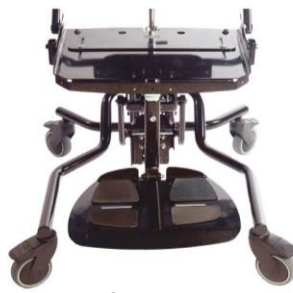
Chasis Hi Low