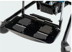
Plataforma metálica Talla 3