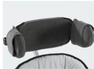
Reposacabezas plano Talla 1 y 2 vinilo gris