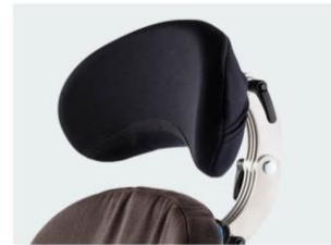
Reposacabezas contorneado tallas 1 y 2