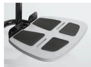
Plataforma de madera