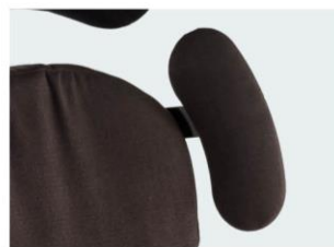
Soportes laterales protractores