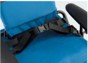
Cinturón pélvico de 4 puntos