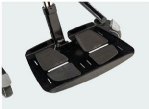
Plataforma metálica Tallas 1 y 2