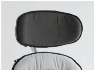
Reposacabezas contorneado Talla 3