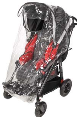
Funda completa lluvia transparente