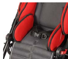
Cinturón pélvico de 2 puntos