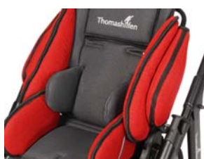
Soportes de tronco