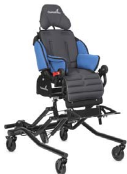
Base para interior Q hi/lo