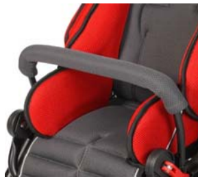
Barra protectora curva reforzada