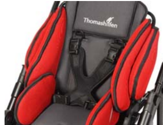
Peto mariposa dinámico de neopreno