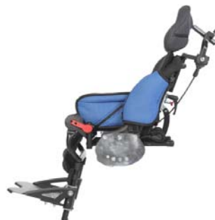
Unidad de asiento Easys Mdular S