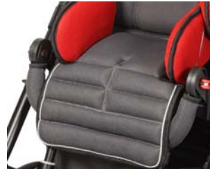
Protector de rodillas para el reposapiés