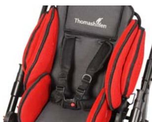
Cinturón en H