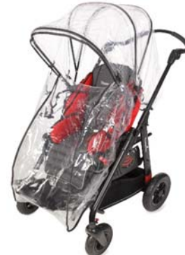
Capa para la lluvia transparente