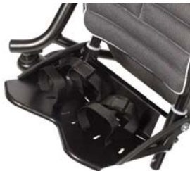
Cinchas para los pies