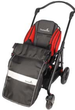
Saco de verano