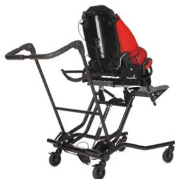
Asa de empuje para base de interior