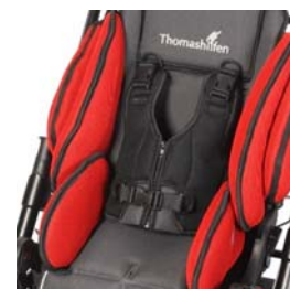
Chaleco de seguridad