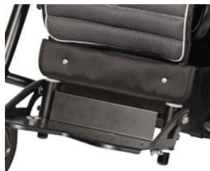
Soporte para pantorrillas