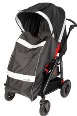
Saco con capota cuerpo entero