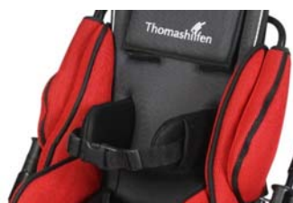
Soportes de tronco con cinturón