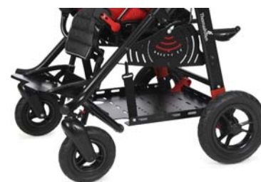
Bandeja para sistemas ventilatorios