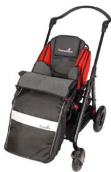
Saco de invierno