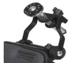
Adaptador para reposacabezas