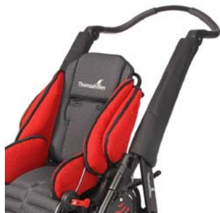
Protectores de tubo