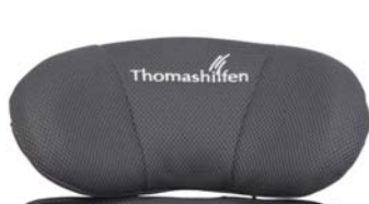
Reposacabezas con soporte sub-occipital