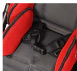
Cinturón pélvico de 4 puntos