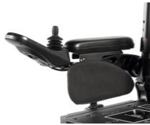
ZIP040142 Protectores laterales