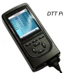
DTT Programador manual