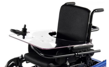
SAL090040 Mesa-bandeja abatible