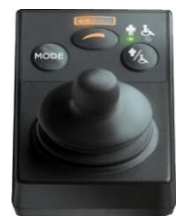
Mando de acompañante