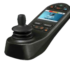
ZIP110017 Mando R-Net con pantalla a color