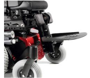
ZIP050038 Reposapiés centrales