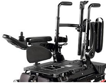
ZIP040122 Reposabrazos standrad