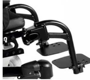
ZIP050035 Reposapiés abatibles a 90°