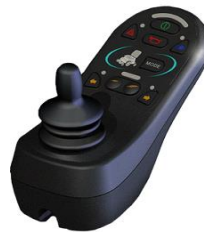
ZIP110016 Mando R-net para Luces e Indicadores