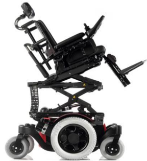
SAL130006 Elevación y basculación eléctrica