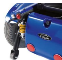
Colores Zippie Salsa R2