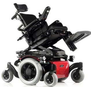
SAL130004 Basculación eléctrica