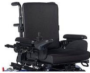
Conjunto asiento y respaldo Jay Comfort