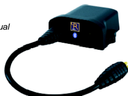
SAL090068 Módulo para Bluetooth