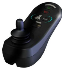
ZIP110015 Mando R-net básico