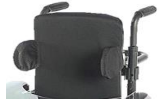
ZIP030004 Soportes laterales