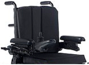
ZIP030301 Tapicería de respaldo Standard