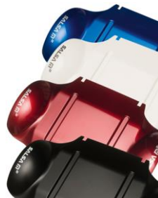
Colores Zippie Salsa M2