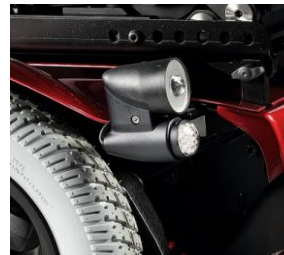
SAL110201 Luces de LED's