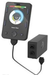
ZIP110116 Pantalla Omni2