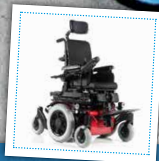
Zippie Salsa M2