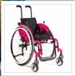
Simba® Generation 2015