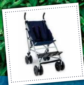
Silla paraguas respaldo reclinable