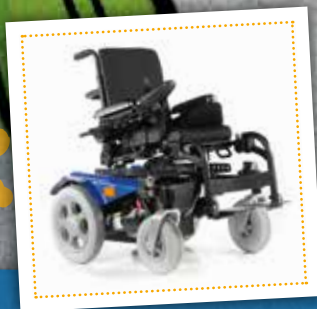
Zippie Salsa R2