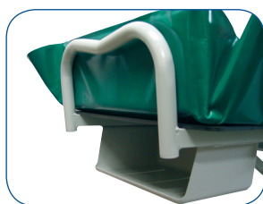
Cesta porta ropa de serie.