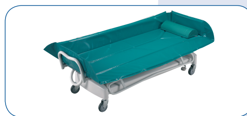
Fácil transferencia del paciente gracias a la posición baja de 52cm. Acercando el carro a la cama, la transferencia puede realizarla una sola persona.