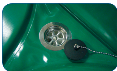
Desagüe de evacuación fácil de usar. Plano inclinado a 2°.