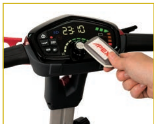
Pantalla multifunción y llave de proximidad