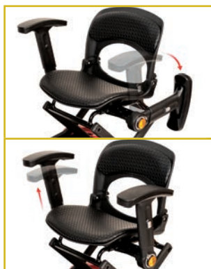
Reposabrazos abatibles y regulables en altura y anchura.