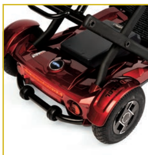
Ruedas neumáticas y antivuelco