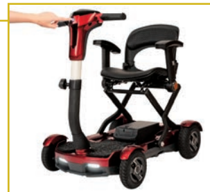
Botón de plegado de fácil acceso.