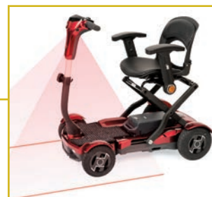
El laser indica el espacio de seguridad necesario para circular.