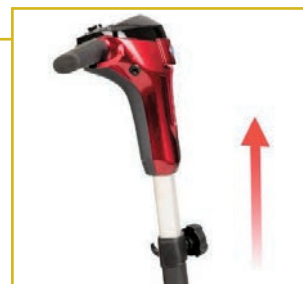
Manillar ergonómico y regulable en altura