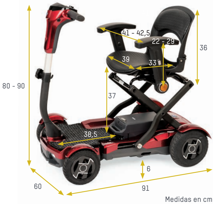
Medidas en cm