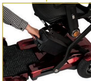
Batería de litio extraíble (14,5 Ah) para facilitar su carga.