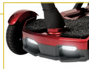
Luces LED delanteras y traseras.