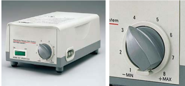
Advance: Ajustable en 8 niveles

El equipo Apex Advance se suministra con manguitos especiales que recubren piernas y brazos por completo. Los manguitos se adaptan perfectamente al paciente. Incorpora tres vías para hacer un drenaje linfático progresivo. Se puede ajustar el equipo a ocho niveles de confort.