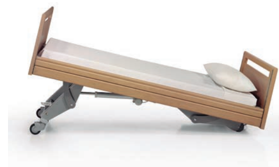
Movimiento antitrendelemburg +- 16°

Disminuye el esfuerzo físico necesario para mover a los pacientes.