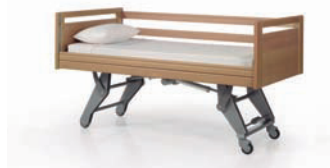
Altura máxima: 68 cm.