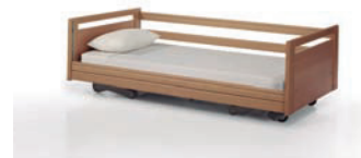
Altura mínima: 20,5 cm.