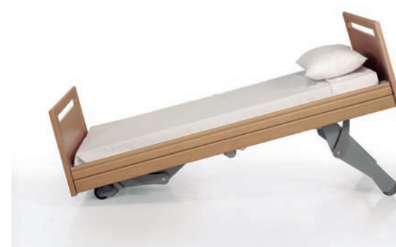
Movimiento trendelemburg +- 16°

Nuestros productos de alta calidad, reducen el tiempo de limpieza hasta en un 30%. Las superficies lisas y sus paneles extraíbles permiten una limpieza y descontaminación fácil y rápida.