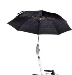
// 7109060 Paraguas, color negro