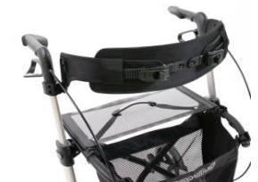
// 7109035 (3) Respaldo ajustable comfort