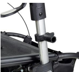
// 7109090 Abrazadera universal