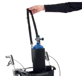
// 7109050 & 7109051 Soporte para bombonas de oxígeno (1)