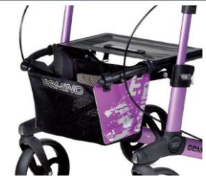
// 7104033 Bolsa estampada violeta/negro