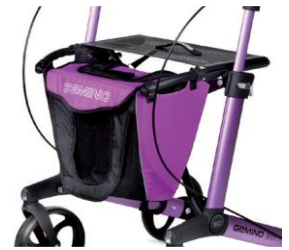
// 7104023 (1) Violeta/negra