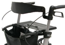
// 7109020 & 7109021 Respaldo (2) (3)