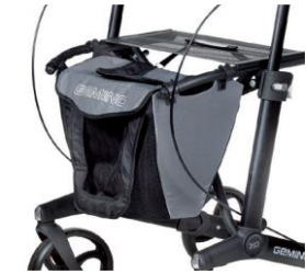
// 7104025 (1) Gris/negra