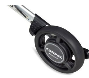
// 9009329 (2) Ruedas SpeedControl

(1) No disponible para Geminos 60 M/60 M Walker. (2) No disponible para Geminos 60 / 60 M y Gemino 60 Walker/60 M Walker.