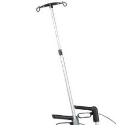
// 7109100 Soporte de gotero