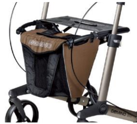
// 7104024 (1) Marrón/negra