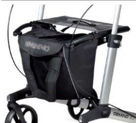
// 7104006 (1) & 7104007 Bolsa Advance con tapa y asas negra