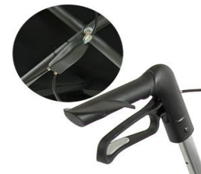
// 7109071 (2) Freno de una sola mano