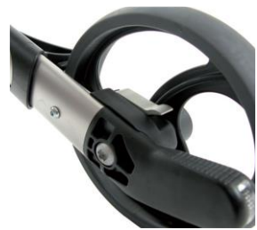
// 7109080 Freno de desaceleración