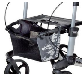
// 7104035 Bolsa estampada gris/negro