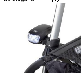
// 7109095 Luz