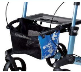
// 7104032 Bolsa estampada azul/negro