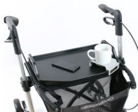
// 7109140 Mesa -bandeja