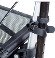
// 7109011 Soporte de bastones