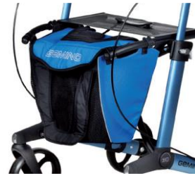
// 7104022 (1) Azul/negra