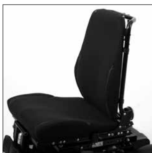
Asiento Contour con contorno suave y tapizado de tela