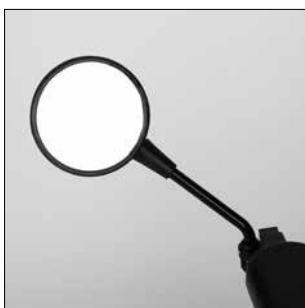
ES 38 Espejo retrovisor