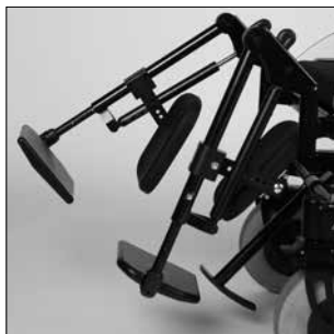
EB 20 Reposapiés elevable mecánico