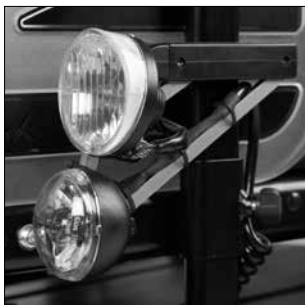
ES 05 Iluminación