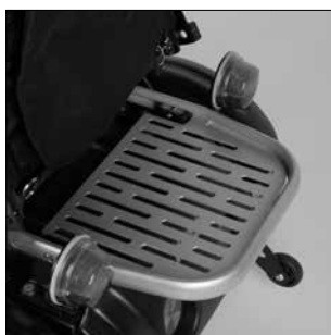
ES 42 Portaobjetos