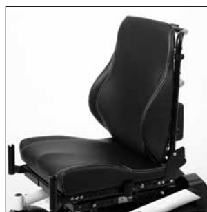
Asiento Contour con contorno profundo y tapizado de piel sintética