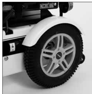
EA 10 Guardabarros, completo