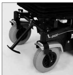
EF 04 Subebordillos