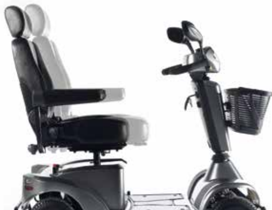
→ Asiento deslizante, ajustable en profundidad

Desde la unidad de asiento hasta la base, todos los elementos de los scooters eléctricos Sterling Serie-S han sido exclusivamente diseñados para ofrecerte un gran confort. La unidad de asiento es ajustable en altura, ángulo y profundidad y los reposabrazos pueden ajustarse en anchura, ángulo y profundidad o abatirse totalmente para facilitar el acceso. Eleva el confort al más alto nivel con los nuevos scooters Serie-S!