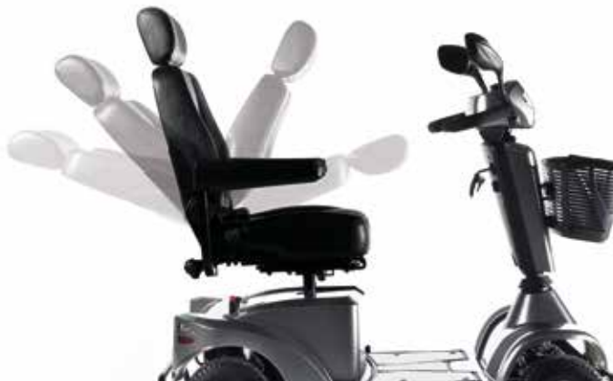
→ Ajuste sencillo del ángulo de respaldo