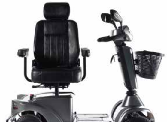
→ Asiento giratorio que hace más cómodas las transferencias