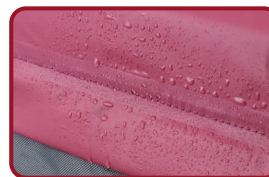
Funda impermeable al agua

*Los defectos o desperfectos debidos a una incorrecta utilización o manipulación del material o los desgastes producidos por un uso normal del mismo, no se incluyen en esta garantía.