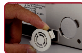
Filtro de aire