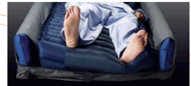
Función de lateralización