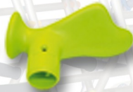
0601.0363 ARA-C PISTACHO