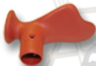
0601.0362 ARA-C CORAL