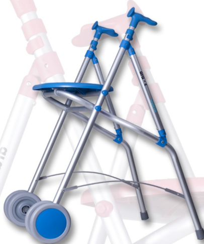
ARA-C AZUL 5015