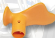
0601.0364 ARA-C SALMÓN