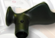
0601.0353 ARA-C NEGRO

POSIBILIDAD DE PERSONALIZAR LOS ASIENTOS CON EL LOGOTIPO DE SU EMPRESA.