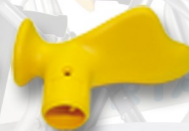
0601.0365 ARA-C VAINILLA