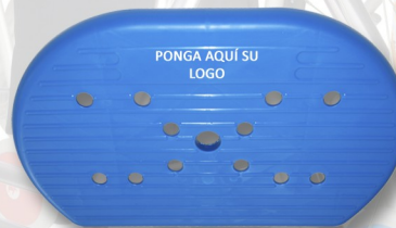
0607.0002 FUNDA ASIENTO ANDADOR

POSIBILIDAD DE PERSONALIZAR LOS ASIENTOS CON EL LOGOTIPO DE SU EMPRESA.