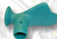
0601.0366 ARA-C ESMERALDA