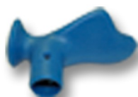
0601.0361 ARA-C AZUL 5015