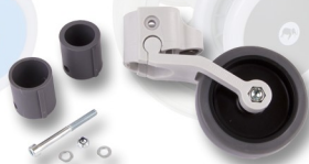
0603.6010 KIT RUEDAS BASCULANTES