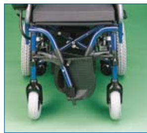
Reposapiés desmontables y abatibles hacia dentro