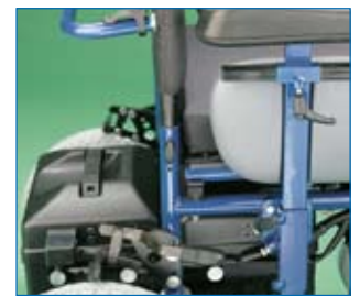
Respaldo ajustable en altura 2.5 cm