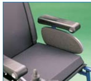
Interior del reposabrazos recubierto de espuma