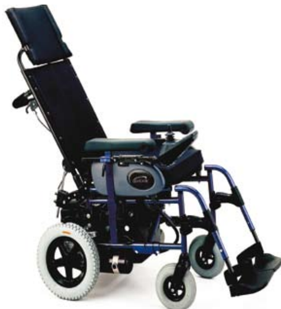
Modelo con respaldo reclinable

Con cojín de serie para un mayor confort del usuario.