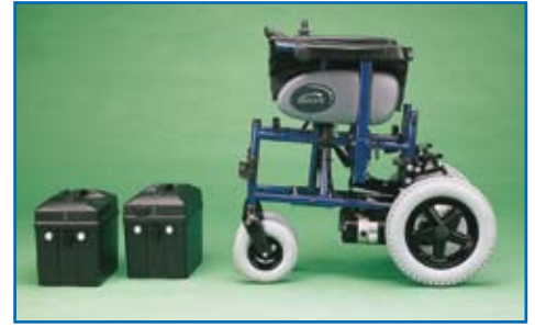
Plegado compacto al retirar las baterías y el respaldo, para facilitar el transporte.

Además las ruedas antivuelco pueden ser retiradas cuando no se precisen.