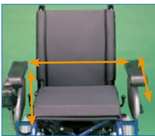
Reposabrazos regulables en anchura, altura y profundidad

F-35 es adaptable a las necesidades de cada usuario. Los reposabrazos pueden ajustarse en anchura hasta 4,5 cms por cada lado. Esto permite ampliar el espacio del asiento hasta en 9 cm llegándose así hasta los 52 cm de anchura. Y mediante una sencilla maneta se regulan muy fácilmente en altura.