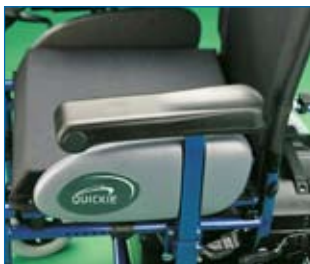
Diseño ergonómico del almohadillado de reposabrazos