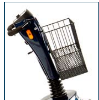
Manillar ajustable en infinitas posiciones. Asa del manillar ajustable en ángulo