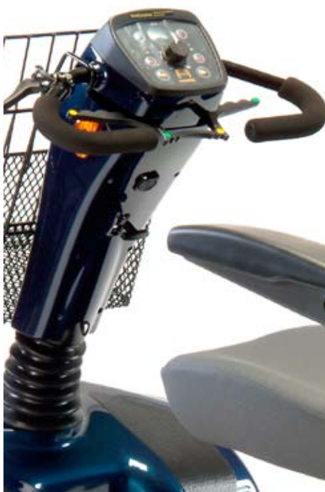
Palanca de velocidad manejable con un dedo