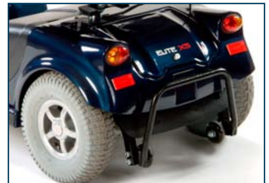
Luces e Indicadores y parachoques trasero