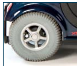
Ruedas de exterior con llantas de aleación