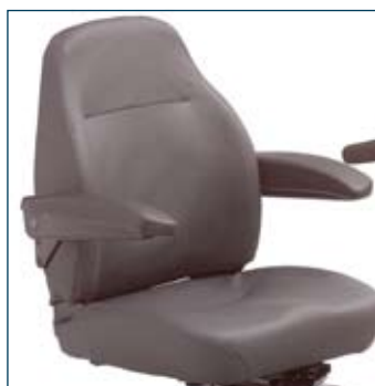
Asiento giratorio 360°, con 8 posiciones fijas y respaldo anatómico con soporte lateral ajustable en ángulo.

El asiento es giratorio 360°, ajustable en profundidad y en altura.